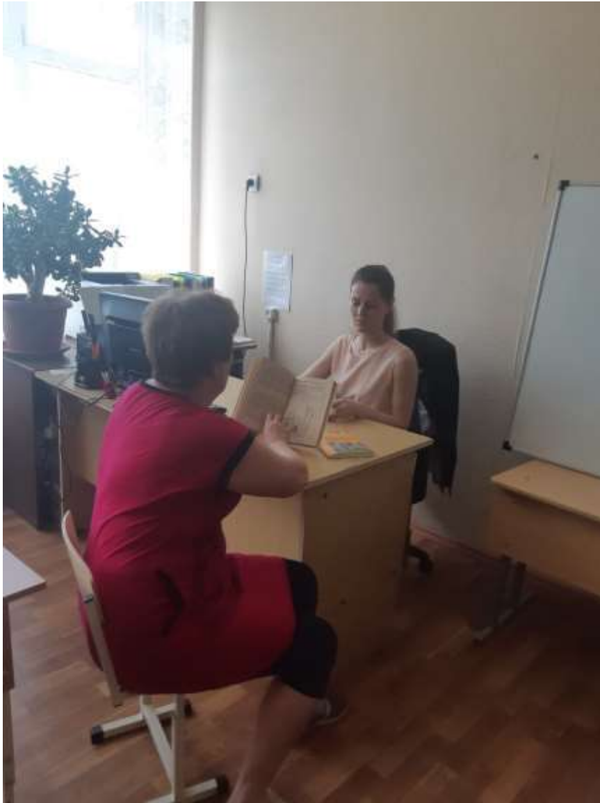
Беседа педагога-психолога с родителями детей