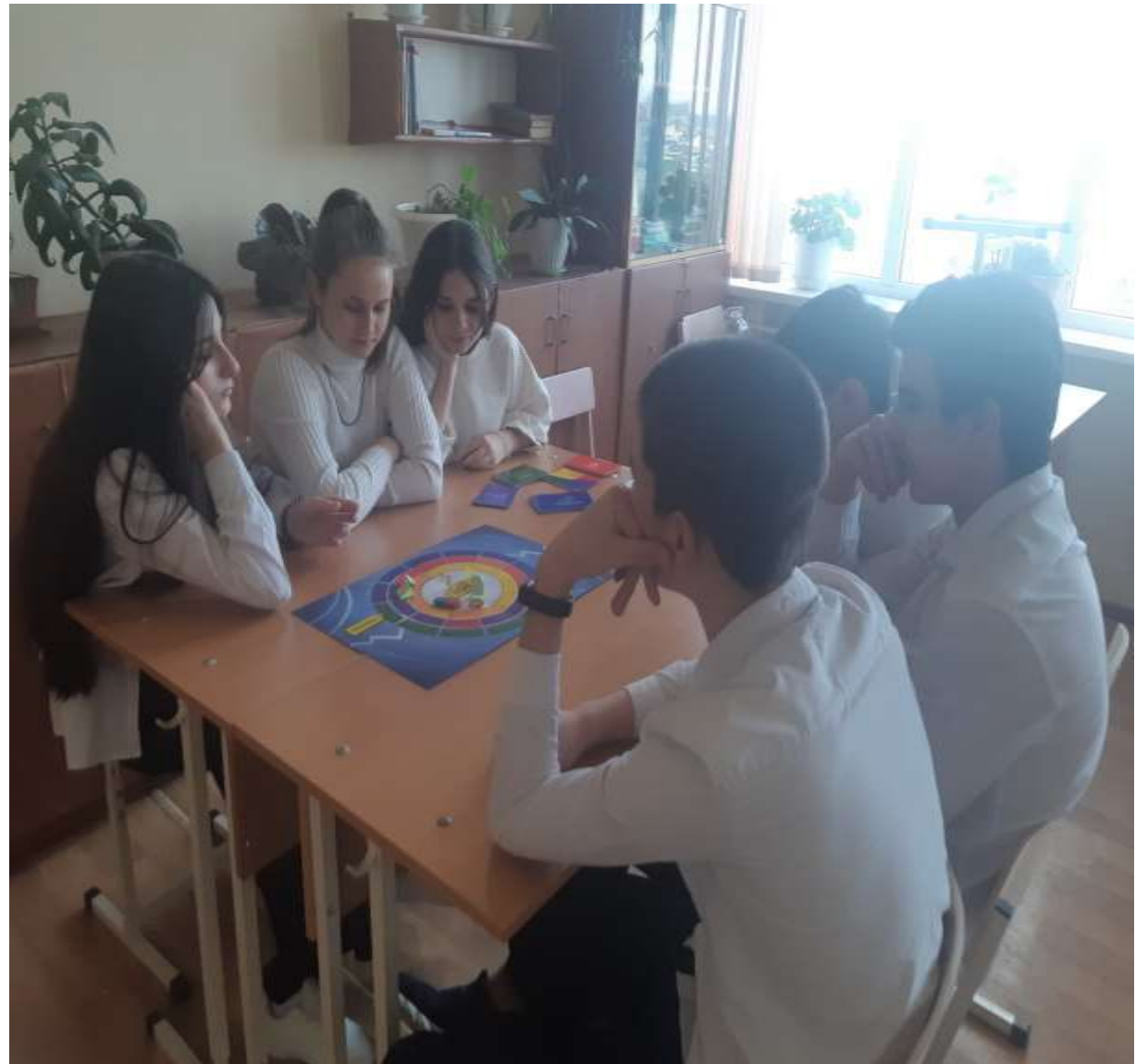
Психологическая развивающая игра «Свой среди своих»